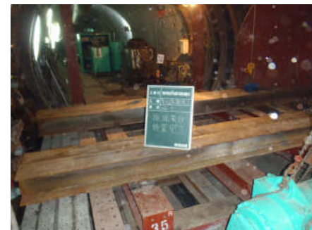
発進架台設置完了