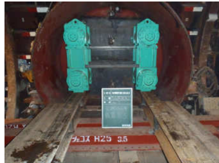
元押しジャッキ設置完了