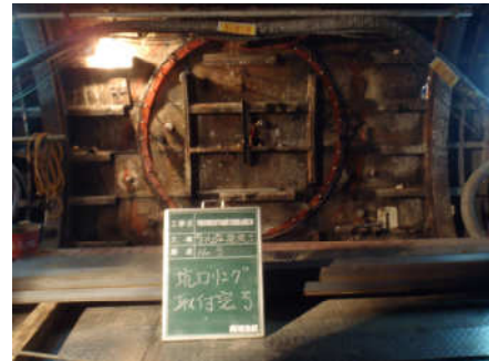
発進坑口取付完了