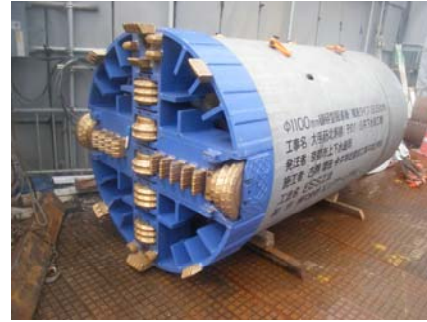
巨礫破砕型掘進機