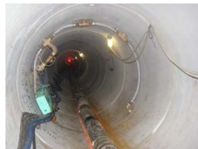
ES（推進力低減）システム