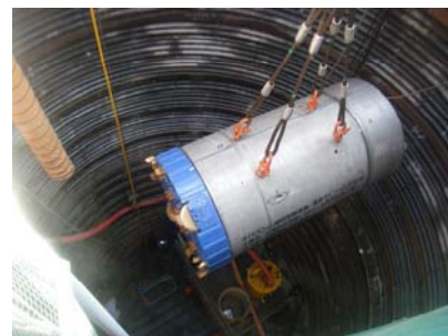
掘進機吊り降り状況