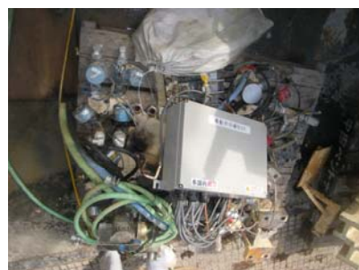
撤去した内部機器