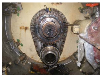
掘進機解体状況（隔壁）